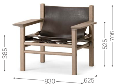
① 北海道タモ GY SO-DGY