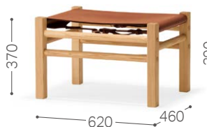
② 北海道タモ NF SO-BR