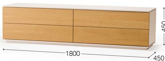
① 北海道ナラ WTMNF