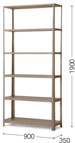
③ 北海道タモ GY