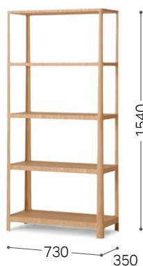
④ 北海道タモ WNF