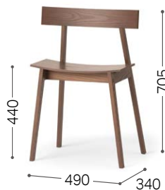
② 北海道タモ MBR