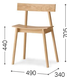
① 北海道タモ WNF