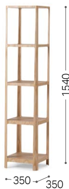
⑥ 北海道タモ NF