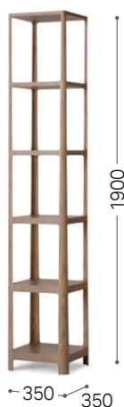
⑤ 北海道タモ GY