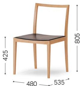
メイプル CF KS-BL/L3