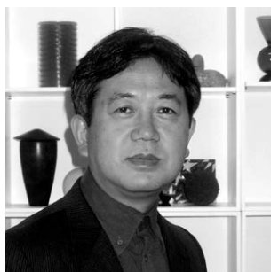
矢萩 喜従郎 Yahagi Kijuro 日本 / Japan