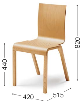
② 北海道カバ NF