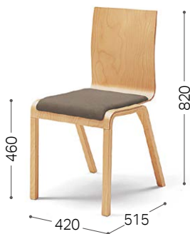
① 北海道カバ NF ウルトラスエード GY/F3