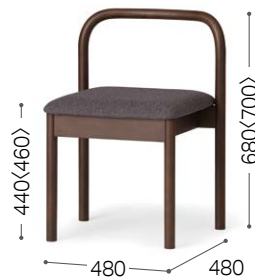
② 北海道ナラ DBR ライク DGY/F3