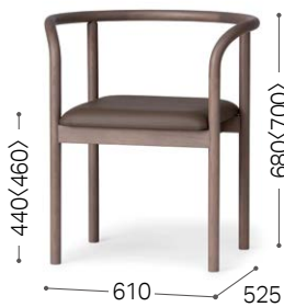
① 北海道ナラ GY MG-KGY/L3