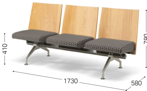
① 北海道ナラ NF 参考布