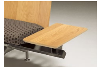
② 北海道ナラ NF