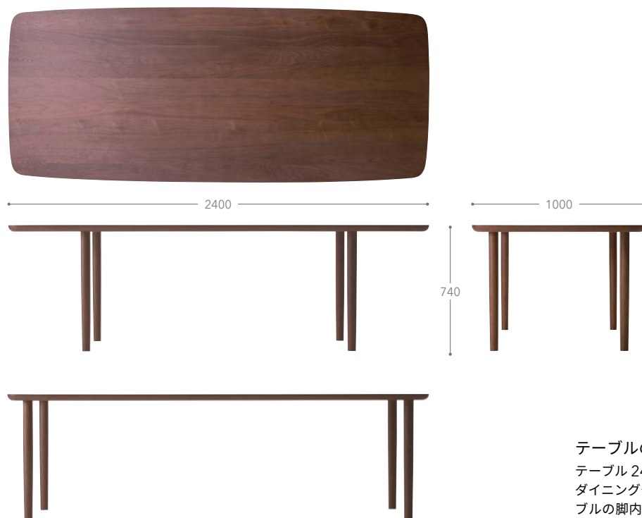
樹種・塗装：ウォルナット CW