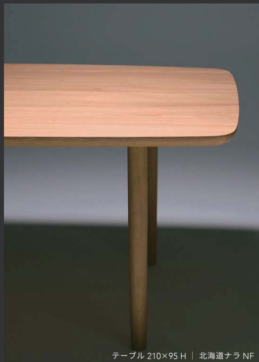
テーブル 210×95 H | 北海道ナラ NF