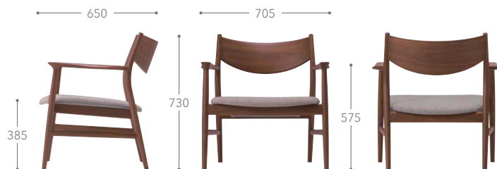
樹種・塗装：ウォルナット CW 張地：トニカ LGY/F4