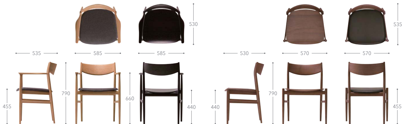
樹種・塗装：北海道ナラ NF 張地：トニカ DGY/F4