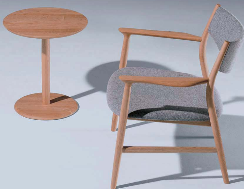
イージーチェア（背張） サイドテーブル φ45 | 北海道ナラ NF トニカ LGY/F4