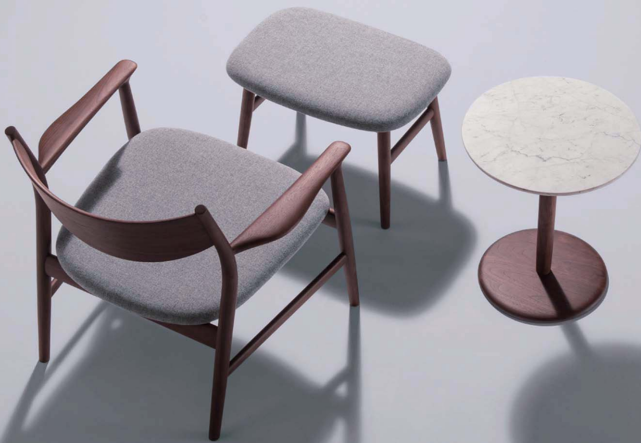
イージーチェア (木背) スツール サイドテーブル φ45 (大理石) | ウォルナット CW トニカ LGY/F4