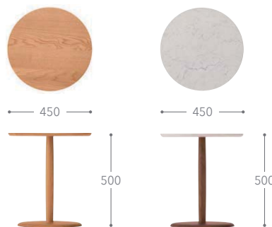
樹種・塗装：北海道ナラ NF 樹種・塗装：ウォルナット CW