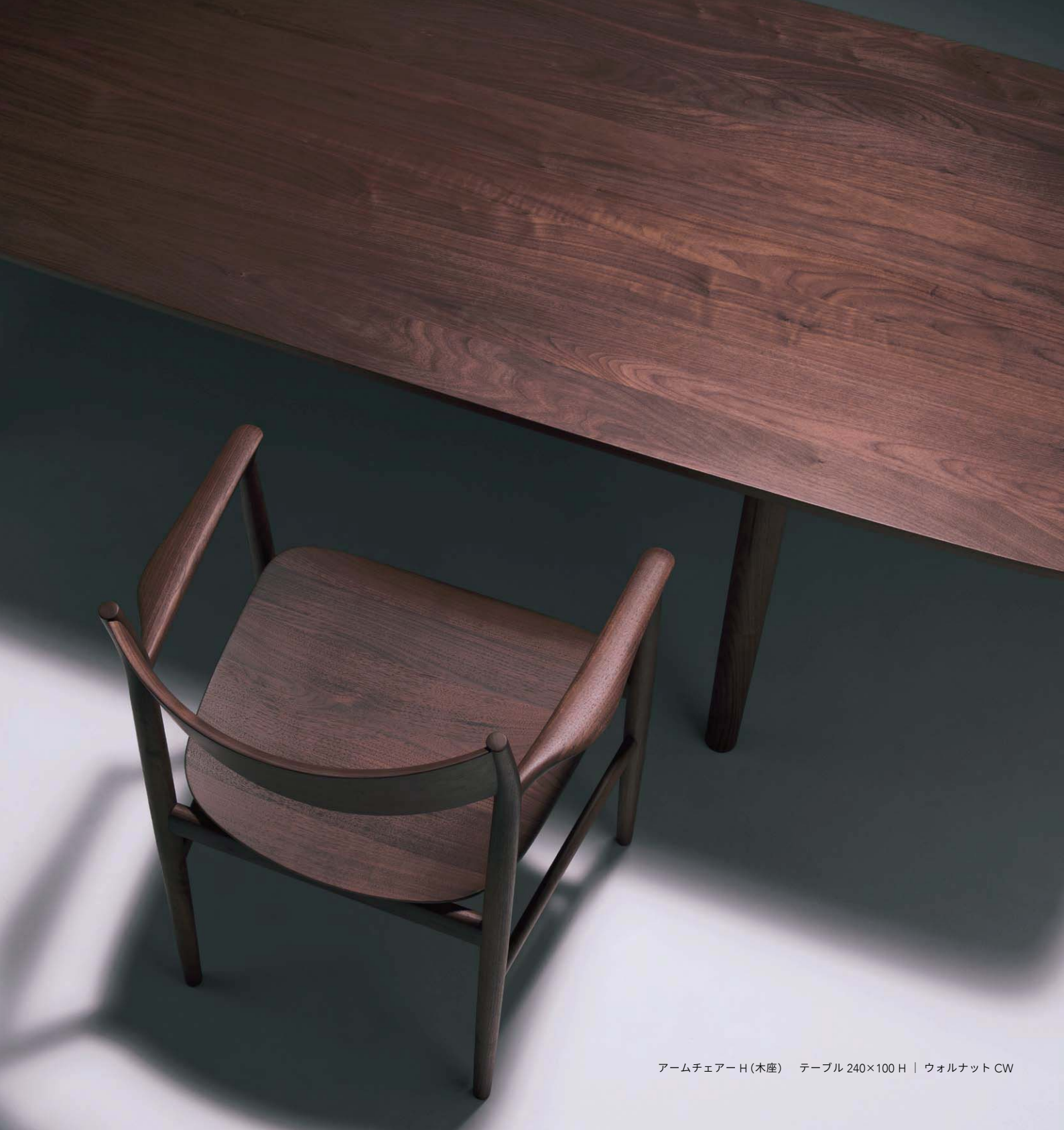
アームチェア-H(木座) テーブル 240×100 H | ウォルナット CW