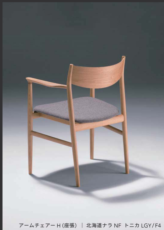
アームチェアーH(座張) | 北海道ナラ NF トニカ LGY/F4