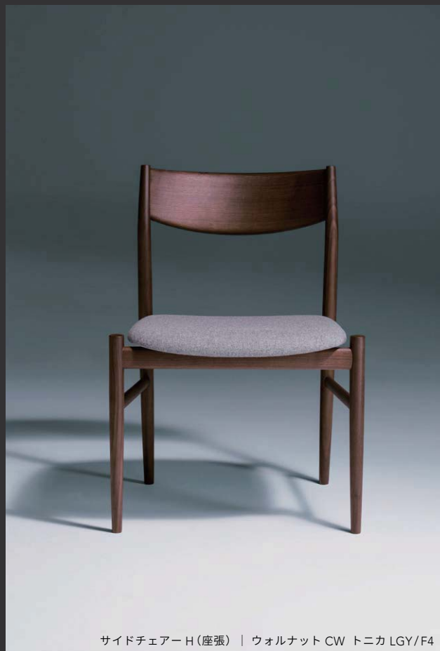
サイドチェアーH(座張) | ウォルナットCW トニカ LGY/F4

デザイナー 深澤 直人氏のデザインの実験から割り出された、「椅子らしい椅子」を中心とするシリーズ。すべてのアイテムに共通する、プロポーションの完成度が特長です。調和のとれた形状を求めて何度も試作を繰り返して辿り着いた、“ふつうで精緻なつくり”と“これ以外ない形”（深澤氏談）。椅子は背、アーム、座のエッジをぎりぎりまで立てることで、緊張感のある美しさと全体の統一感をつくり出しています。ウォルナットと北海道産ナラの2種を用意しました。