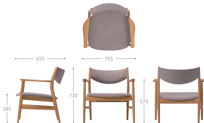
樹種・塗装：北海道ナラ NF 張地：トニカ LGY/F4