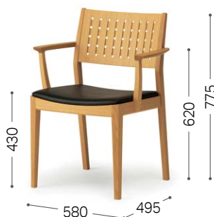
① 北海道ナラ NF RK-BL/L2