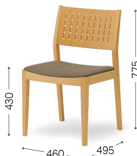
② 北海道ナラ NF ウルトラスエード DGY/F3