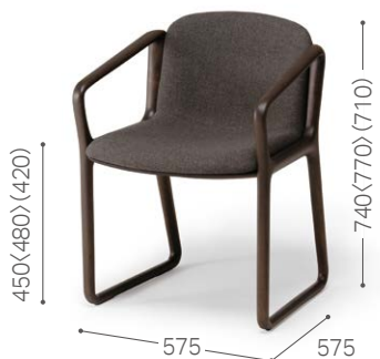
① 北海道ナラ DGY トニカ DGY/F4 (外張り：BQ-BL/L3)