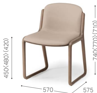
② 北海道ナラ GY MG-LGY/L3 (外張り：MG-KGY/L3)