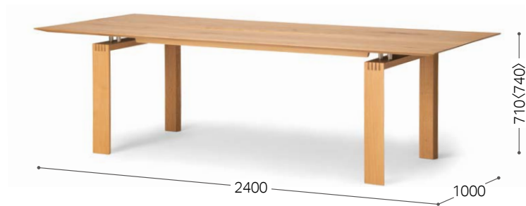
① 北海道ナラ OFN

天板中央底部はステンレスヘアライン仕上げ ※同価格でキャニオンのないタイプもお選びいただけます。